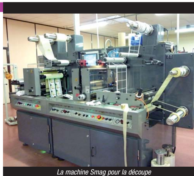
La machine Smag pour la découpe