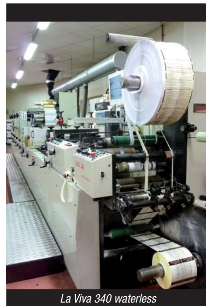
La Viva 340 waterless

L'entreprise traite aujourd'hui une moyenne de 200 commandes mensuelles dans son atelier de 800 m 2 . Au départ, Brachet s'équipe de deux presses typo à plat Onda, puis d'une Viva rotative et quelques années plus tard (2003) d'une Viva 340 waterless offset rotative (cinq couleurs, dorure plus vernis). « Clairement, ce choix était une réponse à une évo-