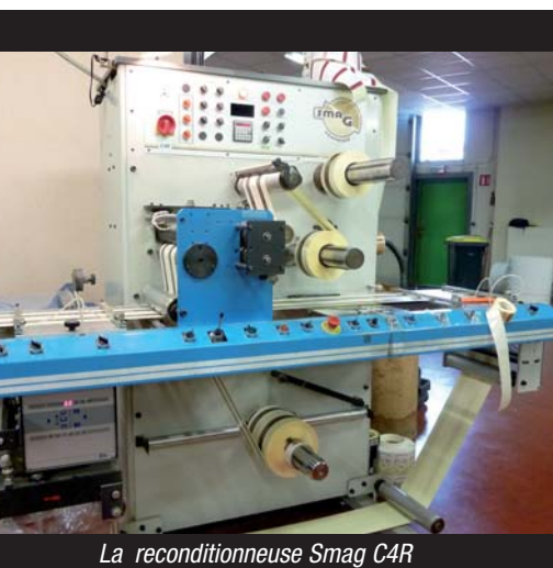
La reconditionneuse Smag C4R